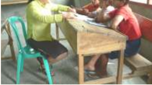
Two teachers share the job to teach 12 youths